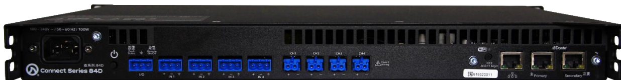
Connect 84D 背面