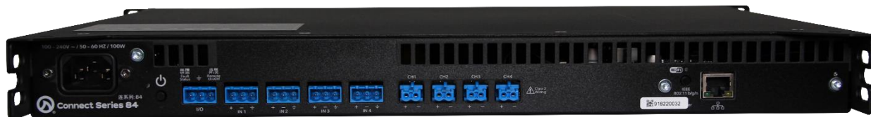
Connect 84 背面

Connect シリーズは、小規模から中規模の施設に適したパワーアンプです。2/4/8ch のラインナップで、それぞれに Dante 搭載モデルがあります。ローインピーダンスまたはトランスレス接続できるハイインピーダンス(70V/100V)の接続が可能で、各チャンネルごとに切り替えができます。Analog Devices 社製 96kHzDSP を搭載し、最大 48dB/Oct のクロスオーバーフィルター、8 バンド PEQ、スピーカー保護リミッターなど、多彩な機能を搭載しています。アンプへの接続には、内蔵の Wi-Fi アクセスポイントを使用する、既存 Wi-Fi ネットワークから接続する、または高速 10/100MB イーサネット接続する、の 3 つの方法があります。ソフトウェアのダウンロードが必要なく、Web UI で PC やモバイルデバイスからリモートコントロール、監視、通知など、多様な制御が可能です。さらに、クラウドからの接続も可能です。Connect シリーズは、LEA Professional Cloud(2020 年サービス開始)に対応した初めてのプロフェッショナルパワーアンプシリーズです。LEA Professional Cloud と Web UI を使用することで、監視や予防のシステムメンテナンスを遠隔で行うことが可能です。